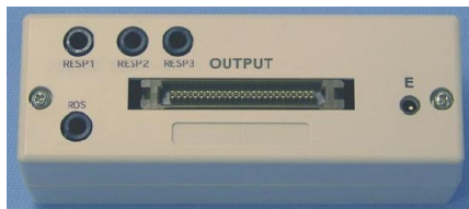
AP-U040(A)m裏面 呼吸、体位、E入力があります。