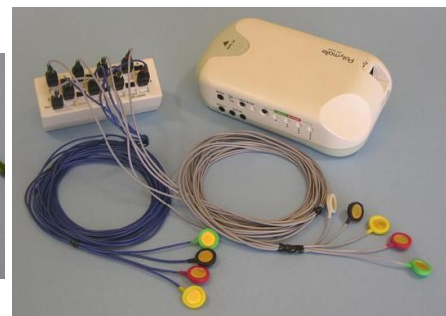
ポリメイトとの組み合わせ例です