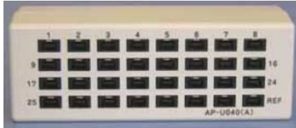
AP-U040(A)m 表面 アクティブ電極×31とRef電極×1 の入力があります。

AP-U040(A)mは、ポリメイト(AP1132m/1532m)で使えるアクティブ電極変換ボックスです。 専用アクティブ電極を最大31本接続でき、多チャンネルで高精度の生体計測を行うことができます。