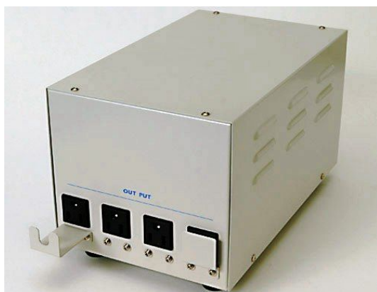
背面 (500W タイプ アウトレット側)