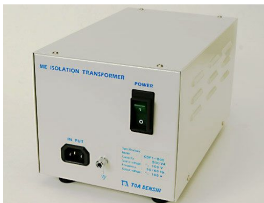
前面 (500W タイプ スイッチ側)